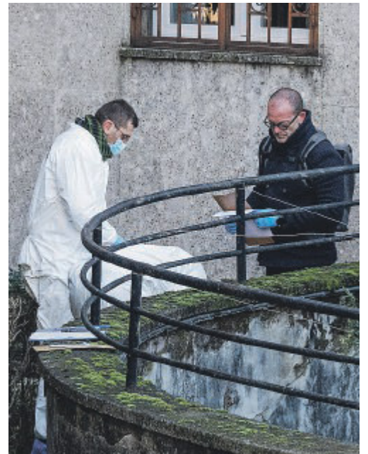
DONNA MORTA Rilievi a Milano