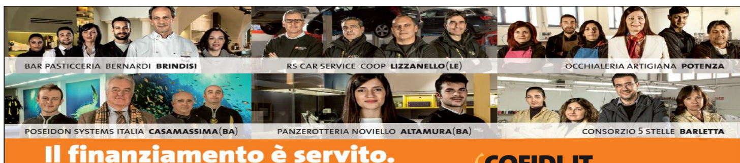
BAR PASTICCERIA BERNARDI BRINDISI

credito delle imprese, con la nostra garanzia. L'evento fieristico ha registrato nella precedente edizione la presenza di circa 250 espositori, 50 dei quali provenienti da fuori Regione, nei settori dell'artigianato, dell'enogastronomia, del commercio e del turismo, contando anche ben 60 comuni rappresentati dai Gal di appartenenza e con altri spazi riservati agli enti locali attivamente promossi da operatori e addetti del settore, il tutto consacrato dall'ottimo risultato di oltre 45.000 visitatori nell'arco dei 5 giorni della manifestazione. L'edizione 2015 si caratterizza per alcune novità: in particolare è presente una nuova tensostruttura, che ospita 30 stand espositivi ed una importante area al coperto interamente dedicata al tema del matrimonio. Inoltre, grazie ad una certosina e laboriosa azione mirata alla ricerca di partner commerciali di rilevante importanza, "Matera è Fiera" vanta della collaborazione con La fiera del Levante e la Ge.Fi. di Milano, organizzatrice della Fiera dell'artigianato. Anche quest'anno, sono confermati quegli appuntamenti d'intrattenimento e di incontro commerciale e culturale che hanno conferito interesse e reso vincente il progetto fieristico.