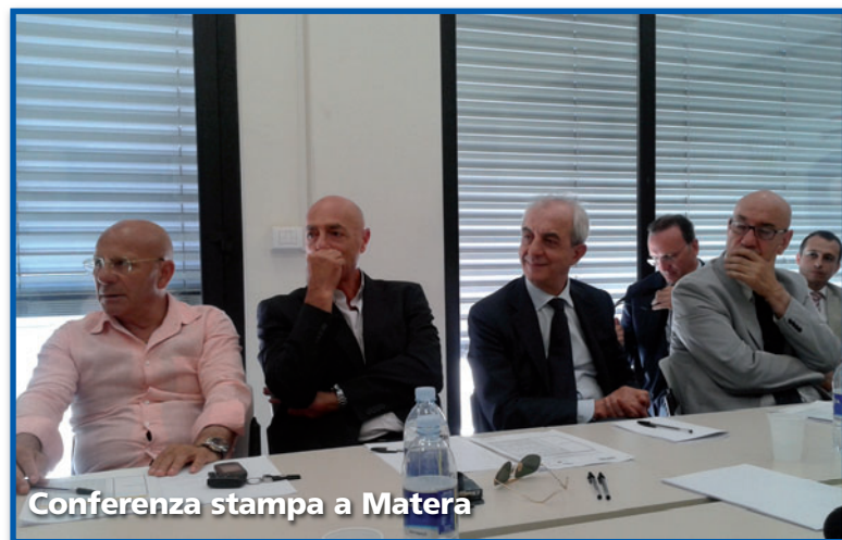
Conferenza stampa a Matera

d'Italia, hanno qualche possibilità in meno rispetto al nostro in termini di prodotti, di impatto sugli accantonamenti che fanno le banche e sulle forme di accantonamento in caso di deterioramento del credito. Abbiamo la capacità di sostenere iniziative anche di ampia portata". Co.Fidi Puglia lavorerà in Basilicata in un'ottica di non sovrapposizione con altri confidi già presenti perché "i confidi nascono dalle imprese per le imprese - ha ricordato il direttore Pellegrino - anche questi fondi di garanzia della Regione sono destina-